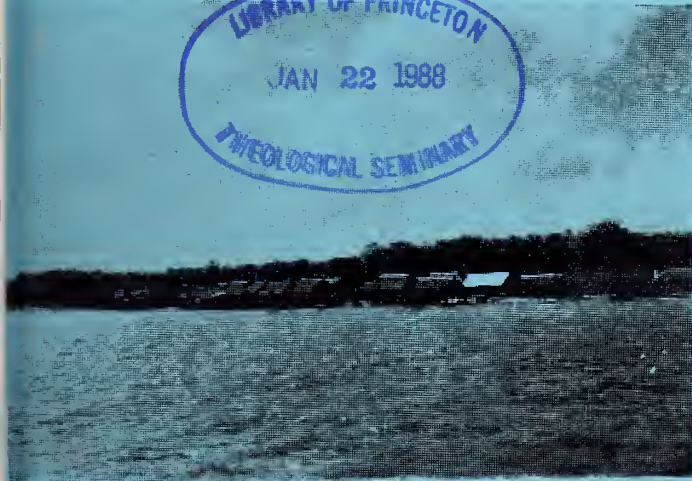
Uno de los caños del Orinoco